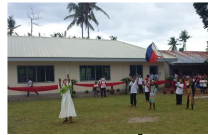
Formelle Übergabe: „Turnover“

Viele von Euch sind nun reif für die Insel (Urlaubszeit!). Ich bin reif fürs Festland, kann auf ein hartes Bambusbett sowie kalten Shower im Freien verzichten. Es war ein hartes Stück Arbeit - mehr möchte ich dazu nicht sagen - aber es hat sich gelohnt. Auch für unsere Arbeiter war es auch nicht leicht, aber sie wurden wirklich gut von den Lehrern und Elternbeirat betreut.“