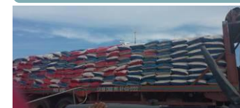
...und wieder per Schiff ...und wieder per LKW...