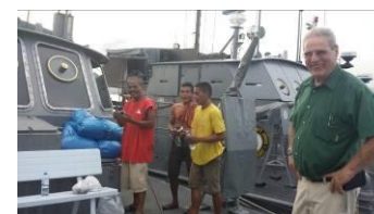
...unter Obhut der „sicheren“ philipp. NAVY: