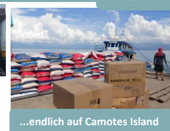
...endlich auf Camotes Island