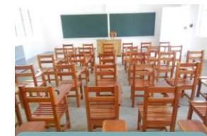
Alle Gebäude von der KiHi vollständig möbliert