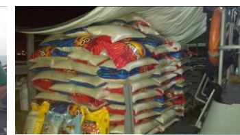
...fehlten 2 Reissäcke