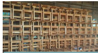
Vom KiHi-Schreiner selbst gefertigt

„Eine völlig zerstörte Schule mit 4 Klassen in Pilar/ Camotes Island ist nun endlich fertig! Es hat bis zur